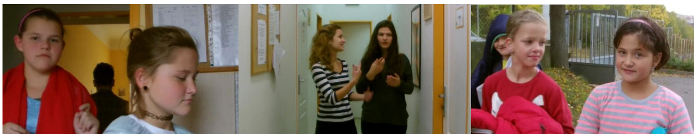
Kroužky MTD 1, 2 a 3

I v letošním roce probíhají kroužky MTD pro neslyšící děti, kde si děti natáčejí krátká videa. Celkem zatím fungují čtyři malé štáby. MTD by ráda kromě natáčení krátkých videí pro školní televizi, reportáží pro ČT, připravila i nové video, se kterým by se mohla prezentovat jak na dalším ročníku Festivalu Oty Hofmana, tak i na dalších dětských filmových soutěžích. Je třeba zdůraznit, že úspěchy, které MTD získala v konkurenci se slyšícími, byly umožněny jen díky týmové práci, aktivitě dětí, spolupráci s učiteli i tlumočníky a samozřejmě podpoře rodičů dětí. Za to je potřeba jménem MTD vyslovit všem zapojeným poděkování.